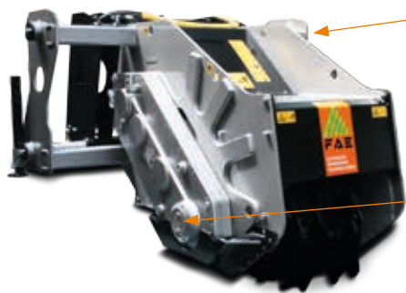
Versión SCH/GT con transmisión por engranaje lateral para triturar hileras de tocones. ↑